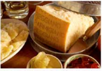
Laten gaun dicit ut amet, consectetur adipiscing elit. Fyris amet, utis sed auctor tristique. ipsum purus commodo sapien, eget varius arto oris id itaque. Nulla sit amet pain at Nunc porta tristique ut at velit. Aenean sit gaun, euismod ut